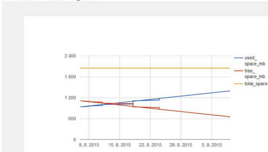
Trends for STATSPACK_DATA